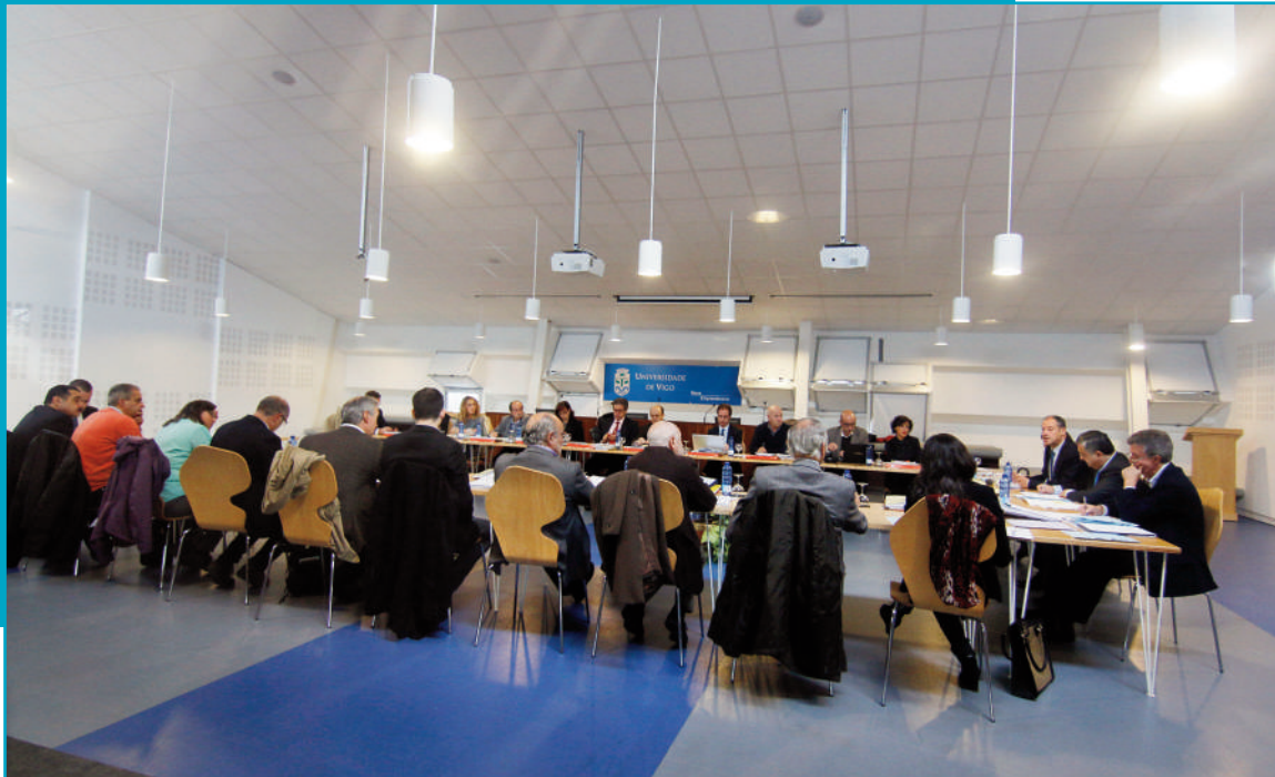
Aspecto xeral dunha reunión plenaria no edificio Miralles, no Campus de Vigo