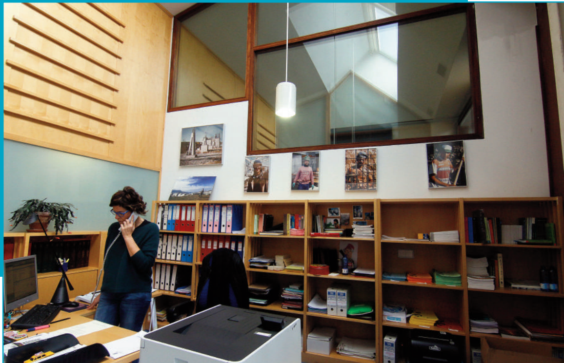
Oficinas do Consello Social, no Edificio Miralles do Campus de Vigo