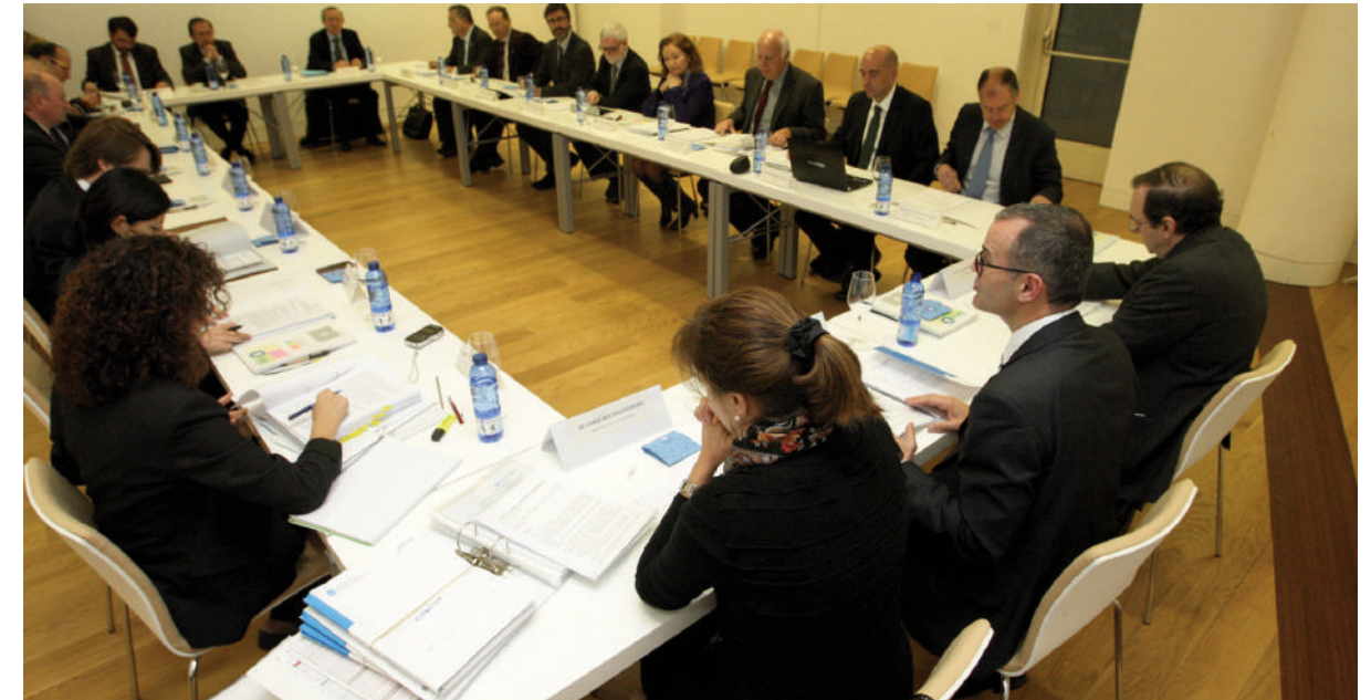
Xuntanza do Consello galego de universidades, en Santiago