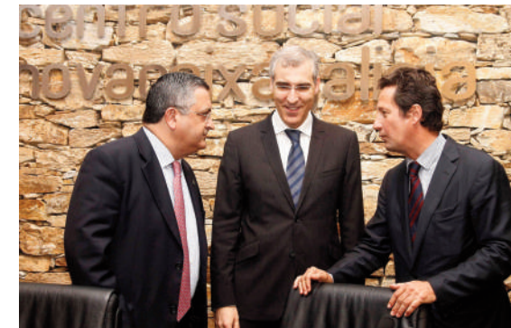
Ernesto Pedrosa, o Conselleiro de Economía e Industria, Francisco Conde, e López-Ibor.

07.05.13 O presidente participou na presentación do libro de Vicente López-Ibor Mayor “Conversaciones sobre la Energía”. O acto foi organizado polo Centro de Investigación Economics por Energy coa colaboración do Consello Social e