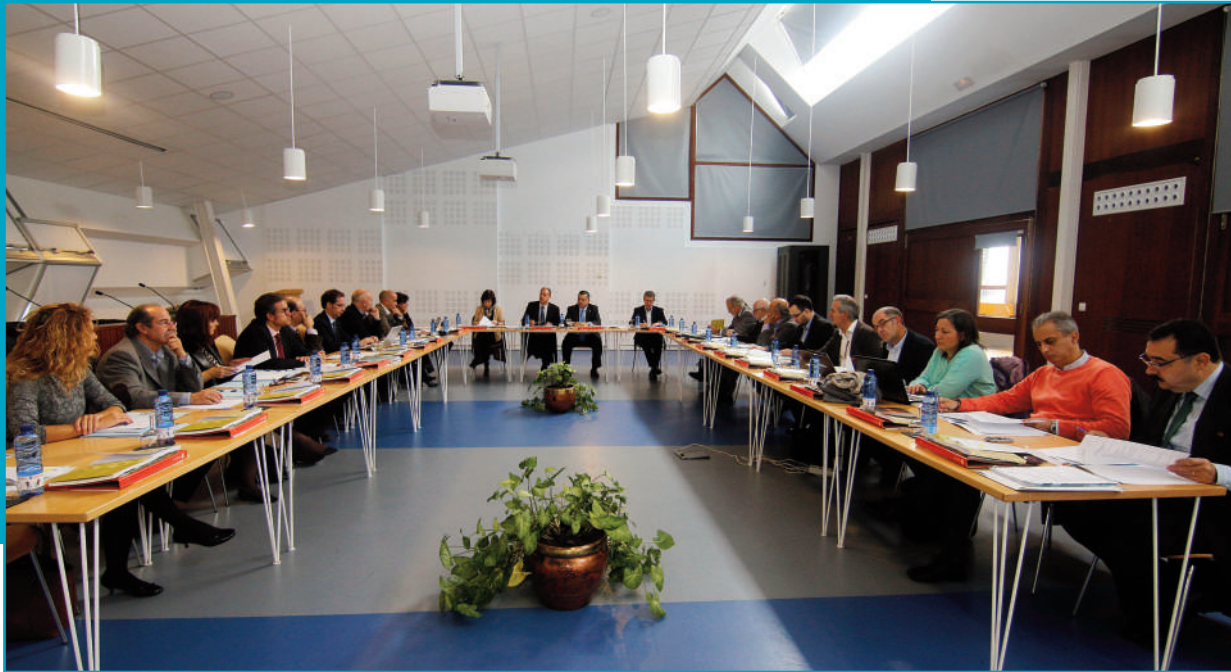
Sesión plenaria celebrado no Edificio Miralles, do Campus de Vigo