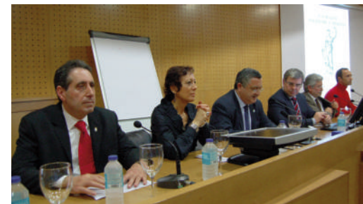
Autoridades académicas, civís e xudiciais, na presentación das Xornadas

02.04.13 O presidente interveu no Acto de inauguración das X "Xornadas Sociedade e Dereito. Cuestións Actuais na Xustiza en España". O acto celebrouse no salón de graos da Facultade de Dereito do Campus de Ourense.