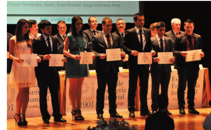
O director da Escola, o alcalde de Vigo, o Reitor e o presidente do Consello Social, tras os alumnos premiados.

O presidente asistiu ao Acto Académico de Investidura como Doutor Honoris Causa da Universidade de Santiago de Compostela do Excelentísimo Se-