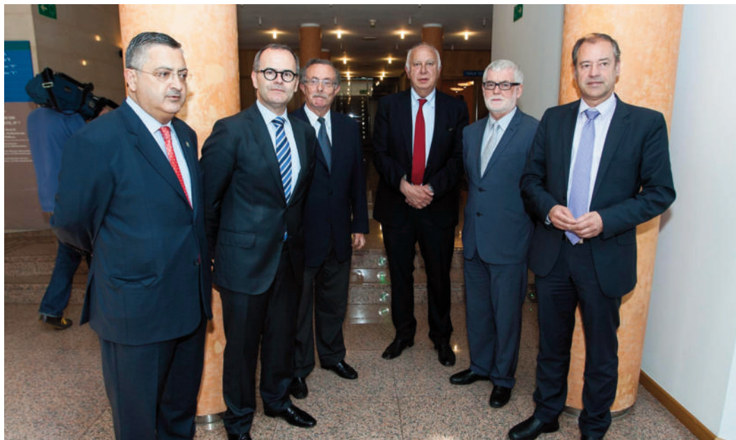
De esquerda a dereita: Presidente do Consello Social da UVigo, Conselleiro de educación, Presidente do Consello Social da Universidade de Santiago, Reitor de Santiago, Reitor de Coruña e Reitor de Vigo.