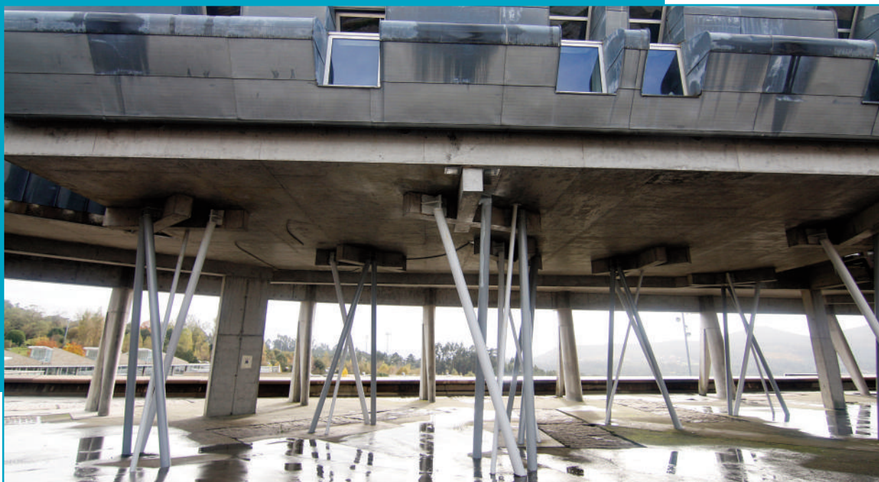
Imaxe do edificio Miralles no Campus de Vigo, sede do Consello Social