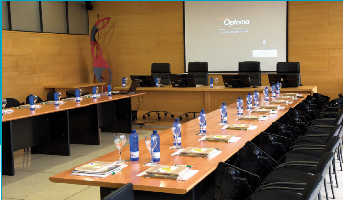
Vista previa da sala de reunión do Pleno do Campus de Pontevedra