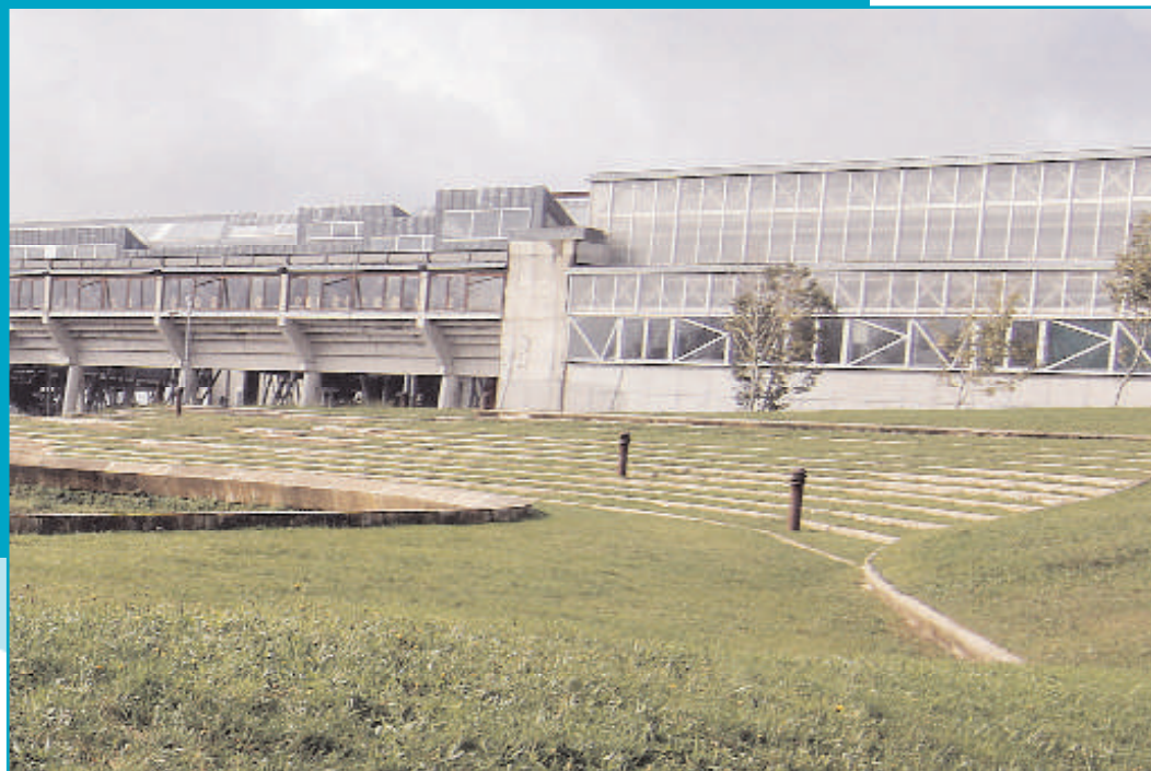
Edificio Miralles. Campus de Vigo